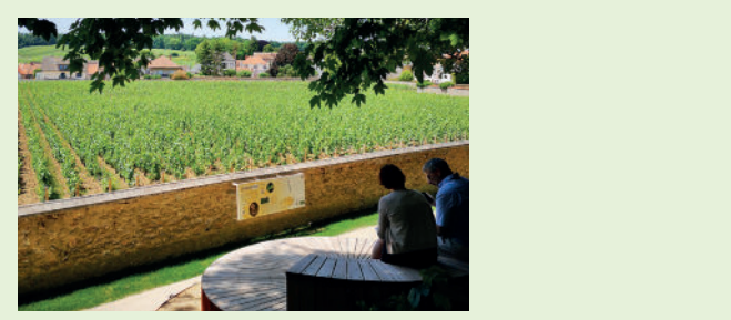
Clos Saint-Vincent - Le Mesnil-sur-Oger Clos Saint-Vincent • Clos Saint-Vincent