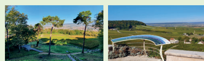
Mont Bernon - Epernay Mont-Bernon mount Mont-Bernon berg Jardin de vignes - Cramant Vineyard garden Wijngaard tuin